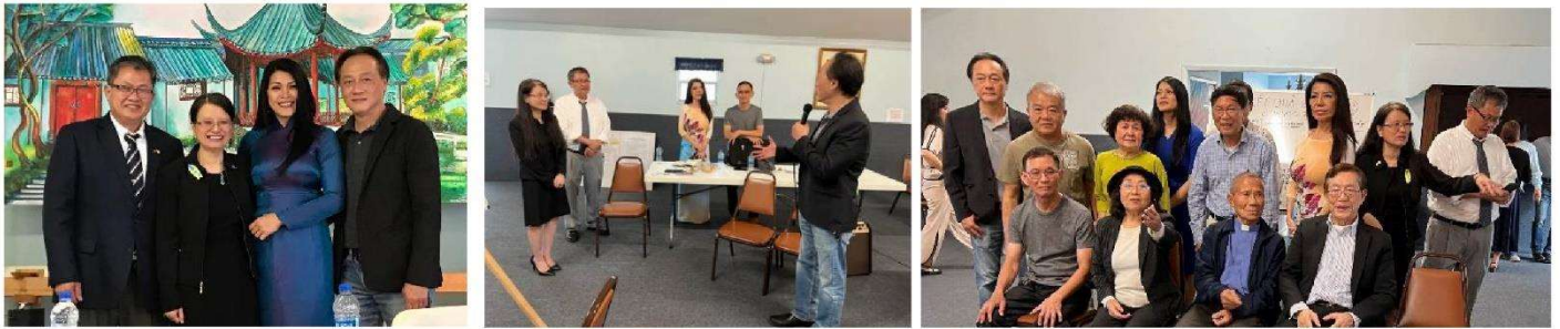
Từ trái: Chụp hình sau khi ra mắt – Chúc mừng liên danh thắng cử - Chụp hình lưu niệm 2 liên danh và cộng đồng

RA MẮT HAI LIÊN DANH: Buổi ra mắt hai liên danh đã được BCH và Ủy Ban Bầu Cử tổ chức chu đáo tại hội quán HO chiều ngày 26/3/2022, Đồng hương có dịp nghe các ứng cử viên trình bày và trả lời các câu hỏi. Kết thúc cuộc ra mắt đầy thân thiện này, 2 liên danh đã bắt tay và chụp hình thân mật. Ủy Ban Bầu Cử đã ấn định hình thức biểu ngữ tranh cử và phiếu bầu một cách công bằng.