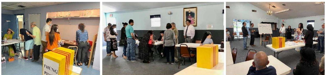
Từ trái: Bỏ phiếu tại Tampa – Ghi danh nhận phiếu bầu (St Petersburg) – Kiểm phiếu