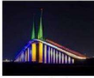
NGÀY MỚI Chủ Nhật 3 tháng 4 năm 2022